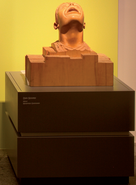
DER SCHREI 2011 Manfred Daringer